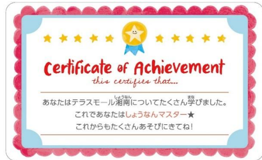
▲しょうなんマスターシール見本