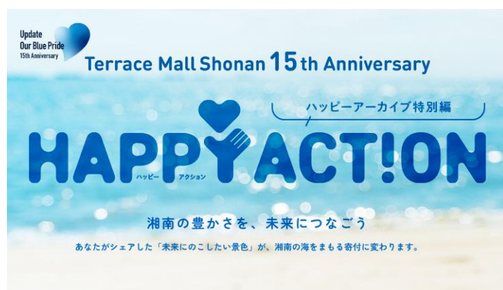
▼投稿写真 掲載イメージ

特設サイト： https://shonan.terracemall.com/2025happy_archive/