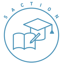
学校・文化施設との共創