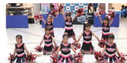
京都ハンナリーズ「はんなりん チアスクール」