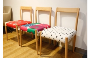
『SOU・SOU(ソウソウ)』 の生地を使用したチェア