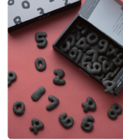
伊藤軒/SOU・SOU 「SO-SU-U・黒ぼうろ」

「SO-SU-U・黒ぼうろ」は、1864 年創業の京都の老舗菓子メーカー『伊藤軒』のお菓子と、SOU・SOU のデザインのコラボレーションで生まれた竹炭を練り込んだそば粉入りの焼き菓子。原料にバターなどを使用していないため、独特の素朴な味わいが甘さ控えめで子供から大人まで親しまれています。