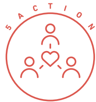
お客様やテナントとの共創