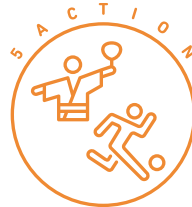
地域団体との共創