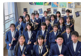
京都市立春日丘中学校 吹奏楽部「奏で~る」