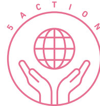
働く仲間との共創

■活動事例： https://sumisho-ud.com/sustainability/