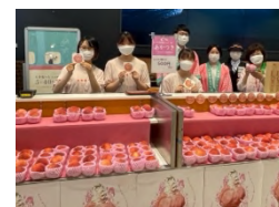
福島市観光コンベンション協会