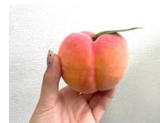
MOMO 狩りチャレンジ抽選の 実物にそっくり?!な桃 食べられません(※2)