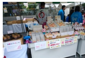
赤磐市 商工観光課