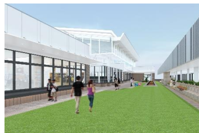
セントラルプラザ（インフォメーション、イベントスペース）